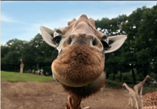
De Beekse Bergen